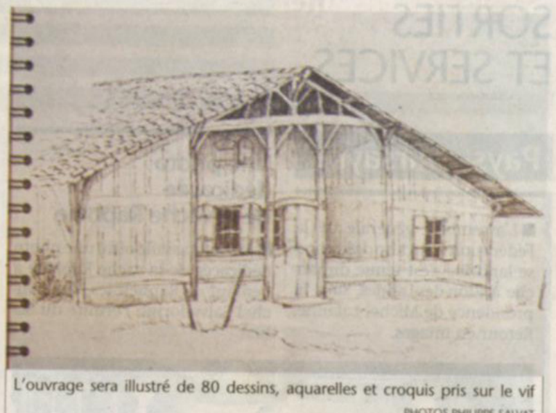
L'ouvrage sera illustré de 80 dessins, aquarelles et croquis pris sur le vif

LIVRE. Un dessinateur, Marc Large et un auteur, Gilles Kerlorc'h ont associé leurs talents pour un livre 100 % landais : « Landes secrètes et croquis sur le vif » qui sortira dans trois mois