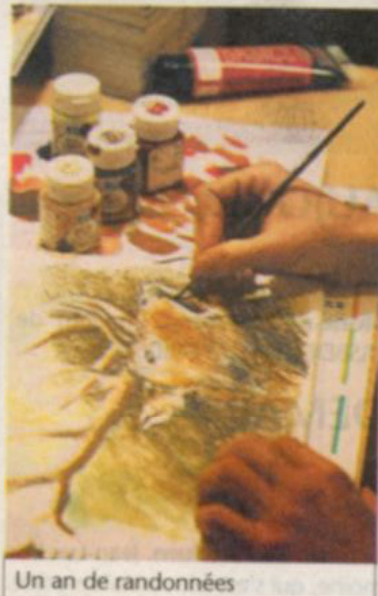
Un an de randonnées