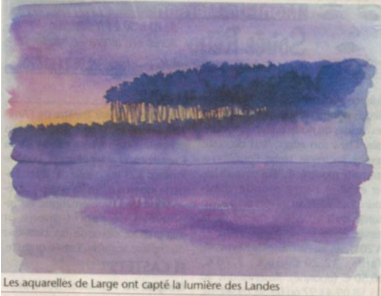
Les aquarelles de Large ont capté la lumière des Landes